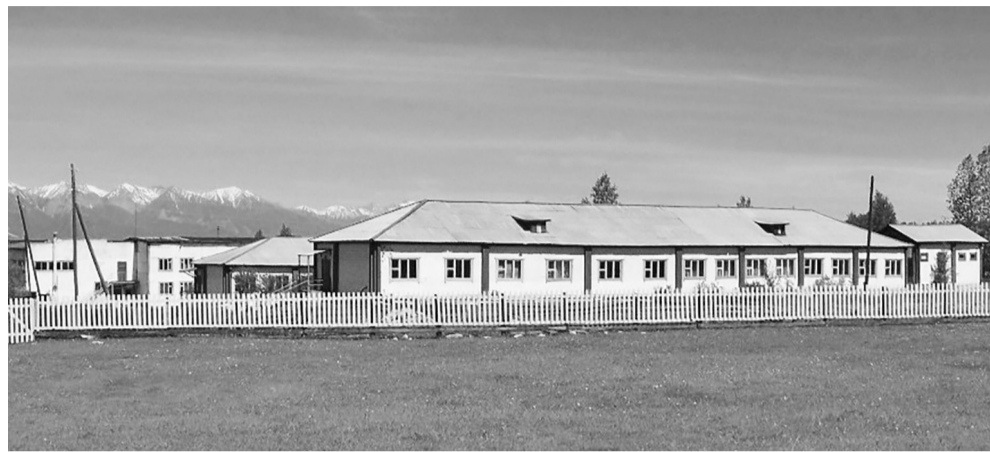
Четыре сегодняшних учителей нашей школы - ее выпускники.